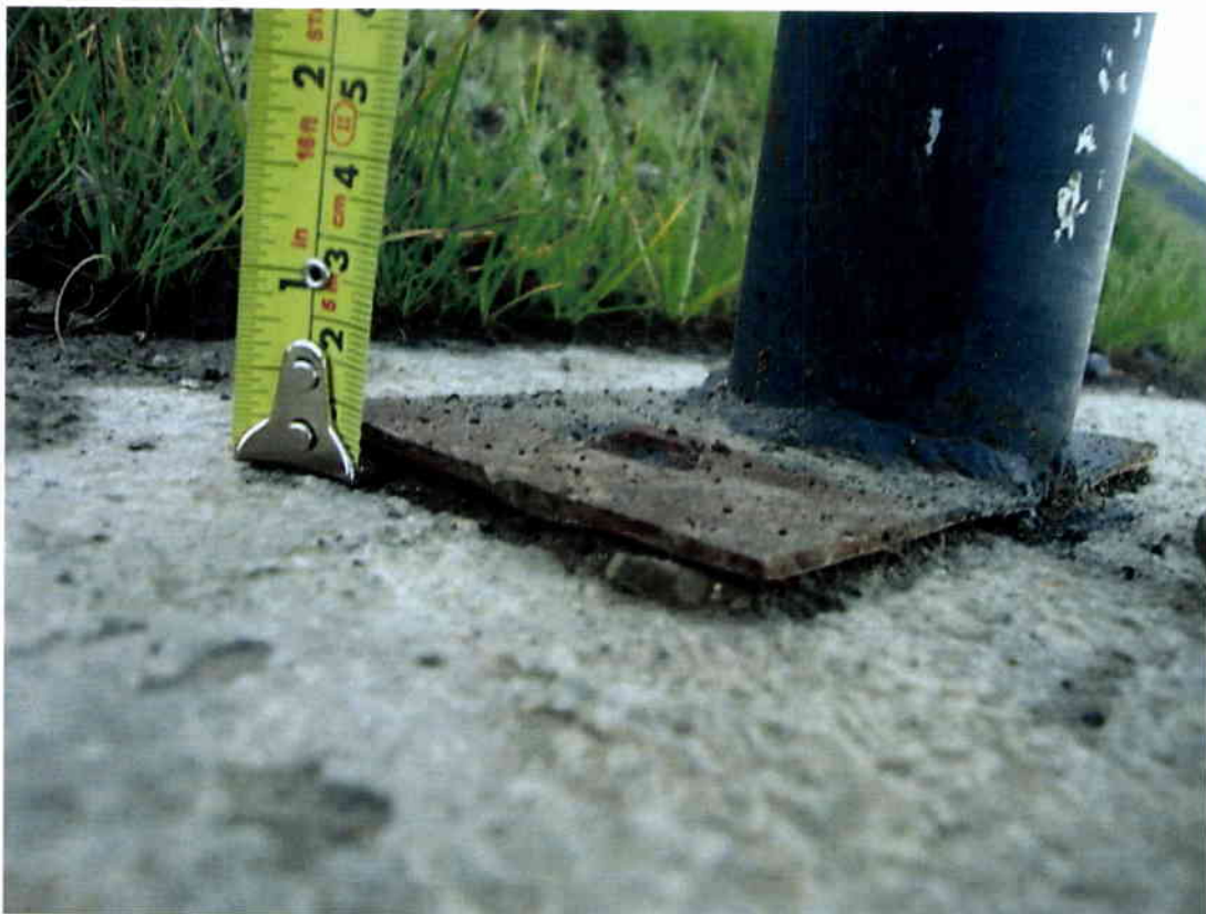
Imagen N° 10 – Espesor placa distinto al informado.