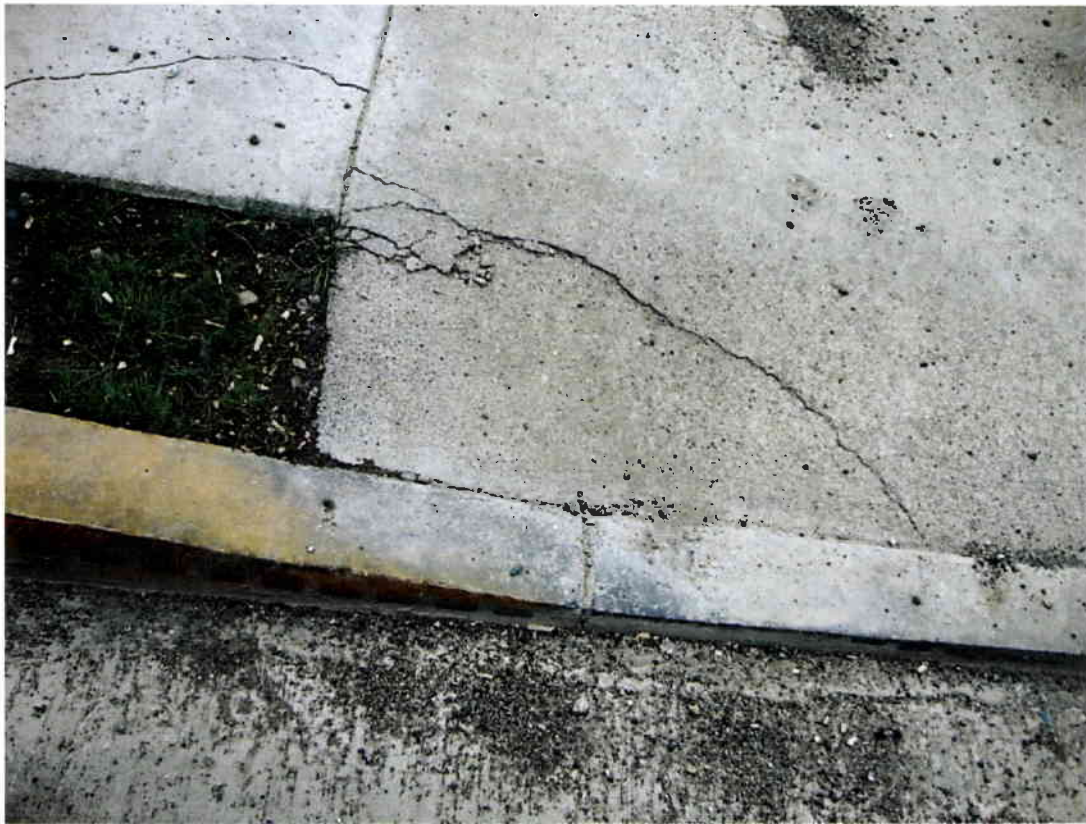
Imagen N° 1 – Fisuras Km 250, acera poniente.