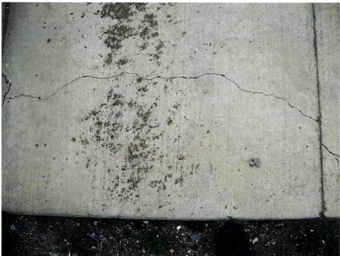
Imagen N° 4 – Fisura frente a Av. Martínez de Aldunate N° 3884.