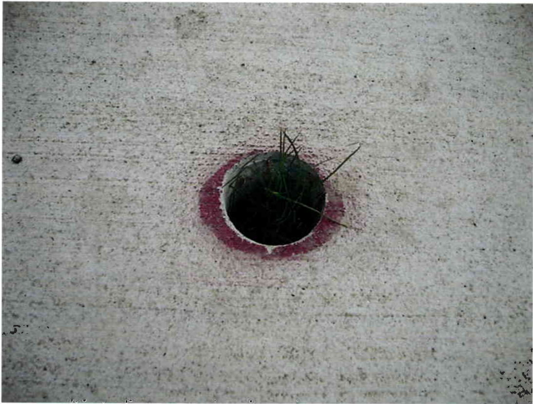
Imagen N° 11 – Falta de retape km 1000, acera poniente.