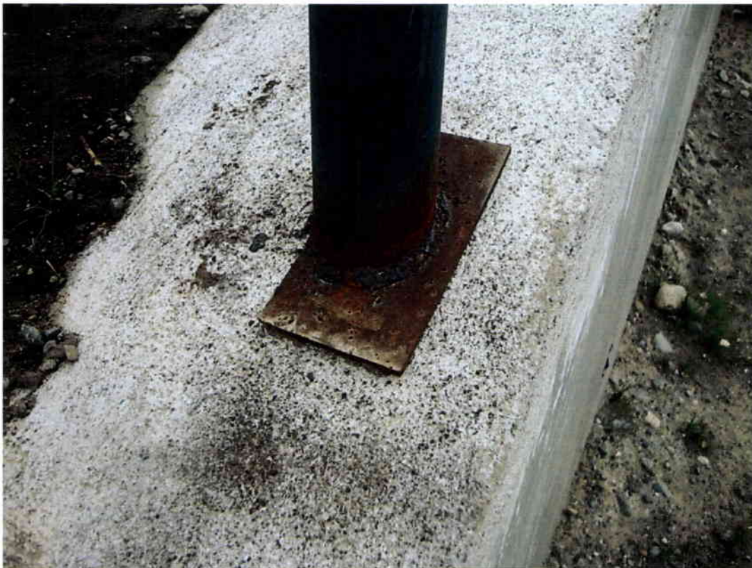
Imagen N° 6 - Oxidación en soporte de perfiles metálicos.