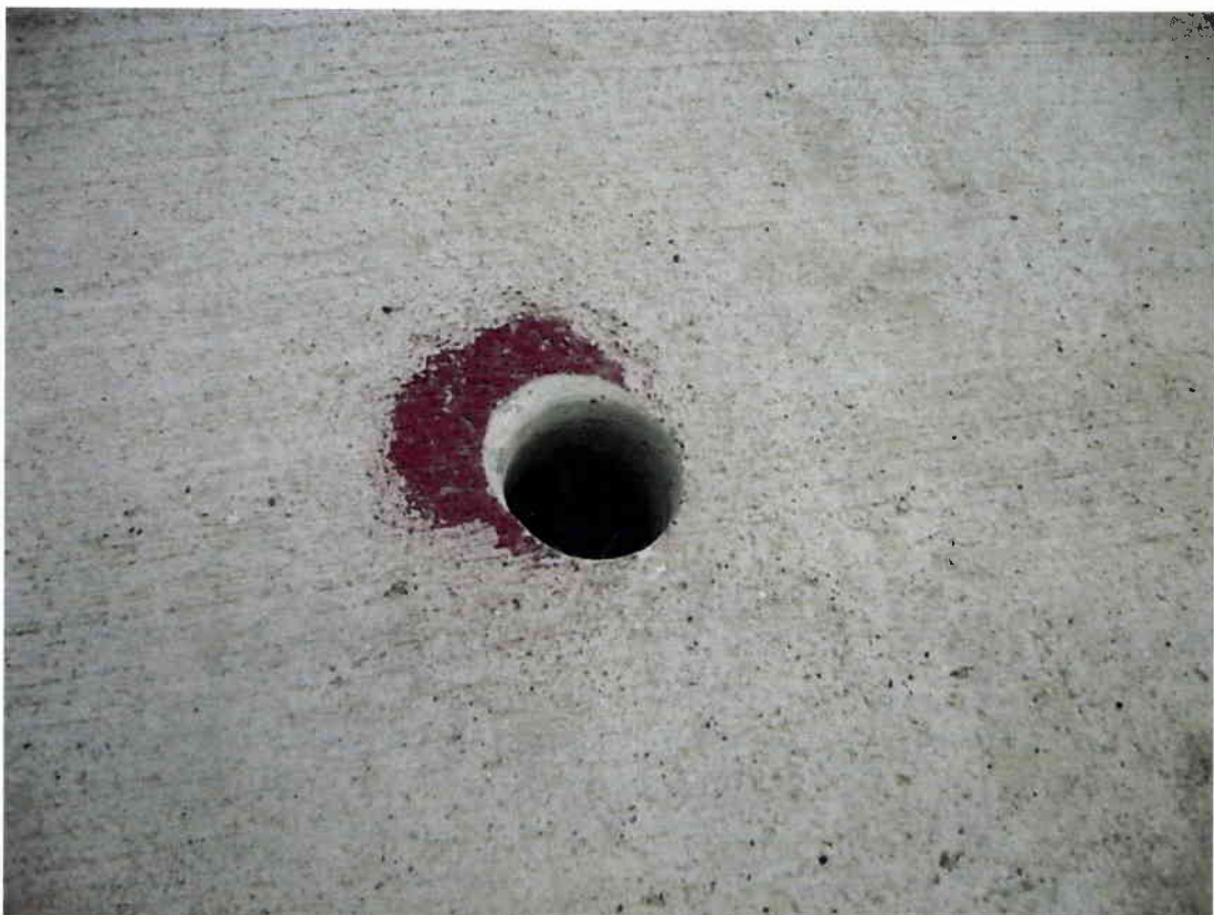
Imagen N° 12 – Falta de retape frente a Av. Martínez de Aldunate N° 3910.