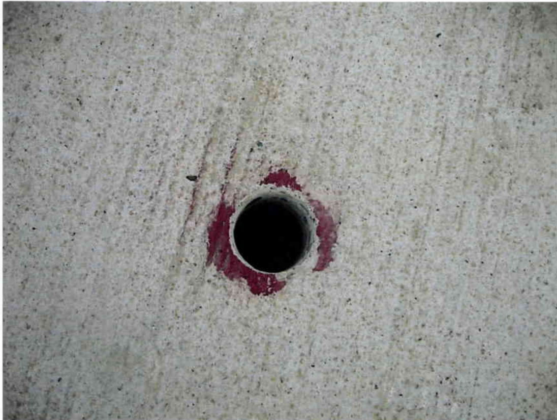
Imagen N° 13 – Falta de retape frente a caseta terminal de colectivos línea 011, acera oriente.