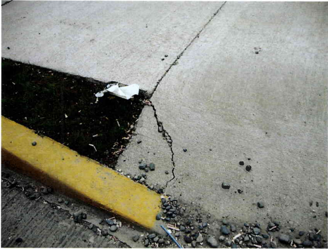
Imagen N° 3 – Fisura esquina norte entre Av. Martínez de Aldunate y calle José Asencio Vera.