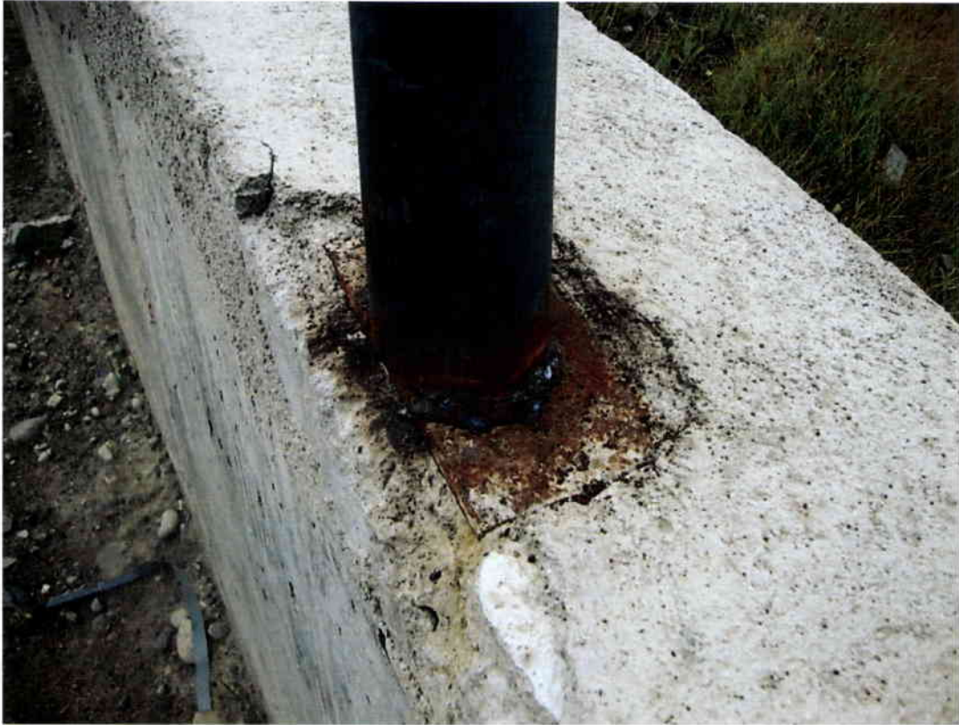
Imagen N° 5 – Oxidación en soporte de perfiles metálicos.