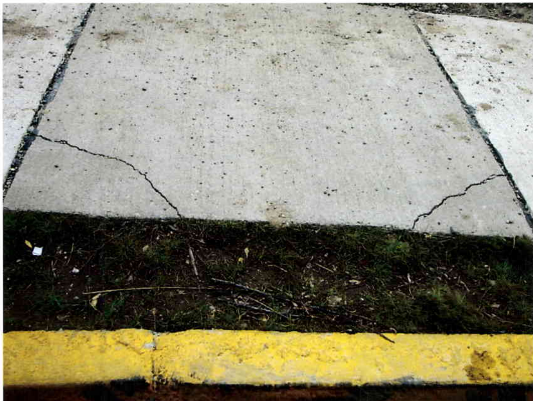
Imagen N° 2 – Fisuras frente a terminal de colectivos línea 433 (frente a calle San Juan), acera poniente.