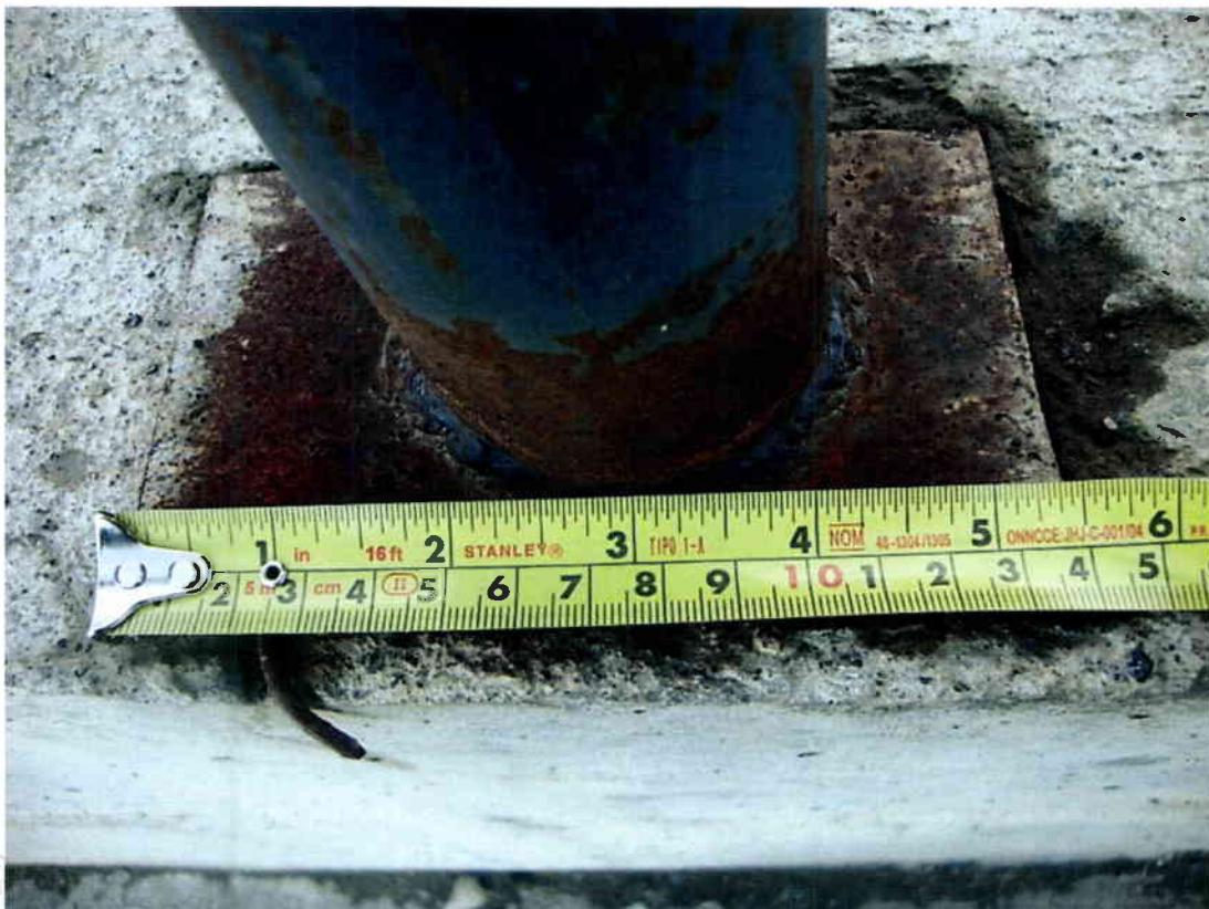
Imagen N° 8 – Dimensión placa distinta a la informada.