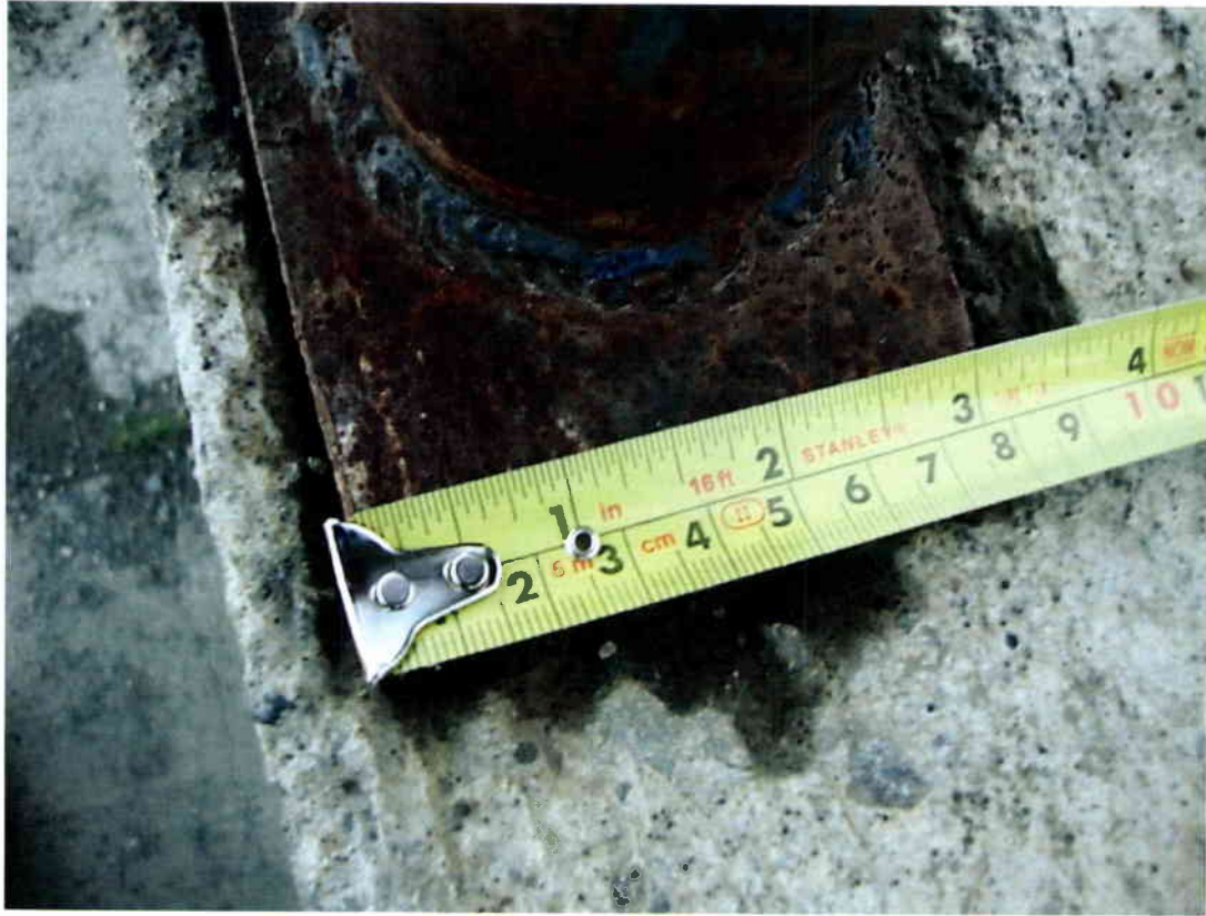
Imagen N° 9 – Dimensión placa distinta a la informada.